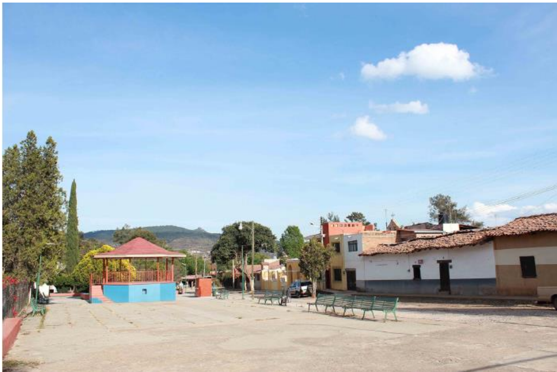
Figura 2 Centro de Palo Alto.

Cuentan los lugareños que Palo Alto nació como un pueblo minero, pero la mina se agotó y la gente se dispersó, dejando la hacienda en el abandono. Pasado un tiempo, fue adquirida por particulares que la convirtieron en huertos de naranjo. Así se reactivó la vida económica para los que se habían quedado ya que hubo oportunidades de trabajo en la granja. Posteriormente, los terrenos pasaron a ser parte del ejido y dieron forma a la comunidad que habitan actualmente ( Figura 2 ).