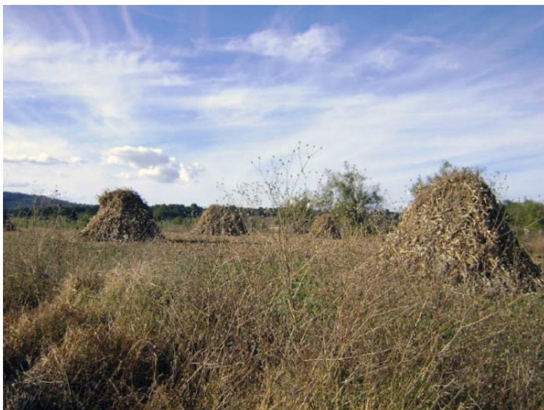
Figura 5 Actividad agrícola.

Entre las fuentes de impacto, se encuentran aquellas relacionadas con la ganadería y la agricultura, como las actividades de roza, tumba y quema de terrenos para el cambio de uso de suelo. Algunos agricultores siembran con maquinaria y otros aún lo hacen con técnicas rudimentarias como el uso de la coa y la agricultura de monocultivo de temporal, principalmente de maíz ( Figura 5 ).