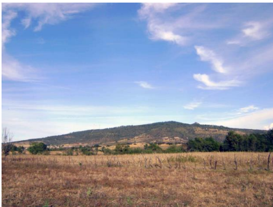
Figura 7 Uso del suelo. Figura 6. Brigadas de reforestación.

Cuando se habla de crear zonas de bosque y reforestar lotes en el ejido, según el testimonio de una entrevistada existe el problema de que todos los lotes están ocupados con alguna actividad agropecuaria, lo que se puede apreciar en el mapa de uso de suelo de la localidad. Gracias a la fotografía aérea y al testimonio de la gente es posible identificar que las parcelas ejidales se dedican al cultivo de maíz y a la cría de ganado bovino principalmente ( Figura 7 ).