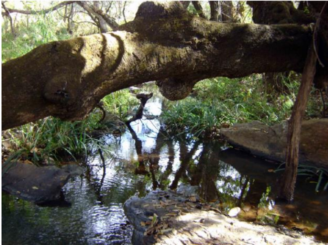
Figura 4 La Ciénega.

En cuanto a las especies documentadas en riesgo están: el tigrillo ( Leopardus pardalis ), el jaguar ( Panthera onca ), jaguarundi, leoncillo ( Puma yagouaroundi ), halcón peregrino ( Falco peregrinus ), murciélago trompudo ( Choeronycteris mexicana ), tuza de Jalisco ( Pappogeomys bulleri alcorni ), zorzal mexicano ( Catharus occidentalis ), orquídea malaxis tepicana ( Malaxis tepicana ), lagartija espinosa del Pacífico ( Sceloporus horridus ), entre otros ( Sistema de Información, Monitoreo y Evaluación para la Conservación, 2017 ). En relación con el contexto ecológico, se hace mención de que la presencia de las especies señaladas es muy importante tanto ecológica como económicamente al ser parte de las cadenas tróficas y para el autoconsumo.