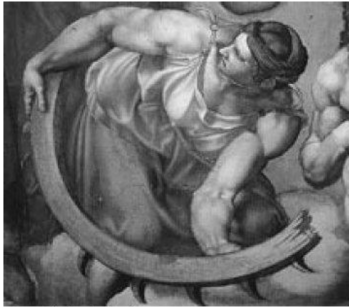
El juicio final, Michelangelo Buonarroti 1537-1541 (detalle)