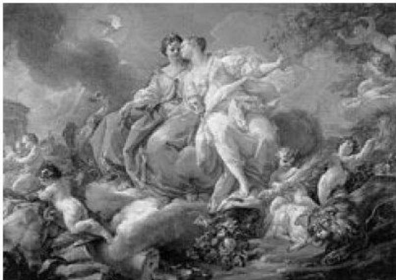
Justicia y Paz, Corrado Giaquinto, 1759-1760

En el texto de la Constitución Política del Estado de 1826, no había ninguna otra norma que hiciera referencia a los indígenas y, las disposiciones relativas a la abolición de la esclavitud u otras similares tenían un carácter evidentemente genérico que, por lo demás, no se reflejaba en la práctica. Se había plasmado en el texto constitucional lo que la realidad política y económica mostraba; Bolivia era un país de los criollos.