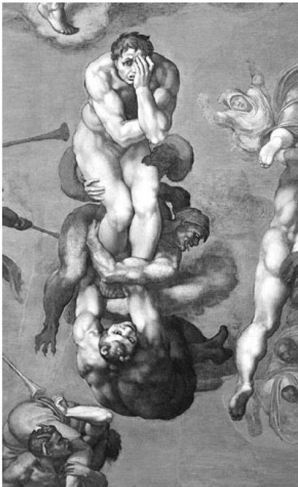
El juicio final, Michelangelo Buonarroti 1537-1541 (detalle)