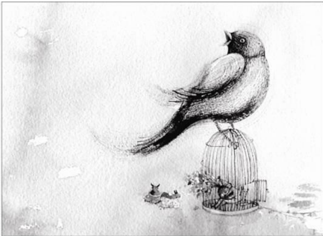
Romanet Zárate. Detalle de Mirabilia II . Acuarela sobre papel de algodón. 2009

En ese sentido el proceso necesita de muchas de las miradas de las mujeres, de las reivindicaciones propias de los feminismos para alimentarse. La pregunta fundamental ahora es: ¿qué es estar dentro del proceso? o ¿desde dónde hablamos? Y habrá que dar respuesta de manera creativa. Entonces creo que hay que disputar el lugar de dónde vamos a hablar, si el proceso se circunscribe a la plaza Murillo, a los ministerios, si el proceso se circunscribe a entornos, o si el proceso se circunscribe a dónde?