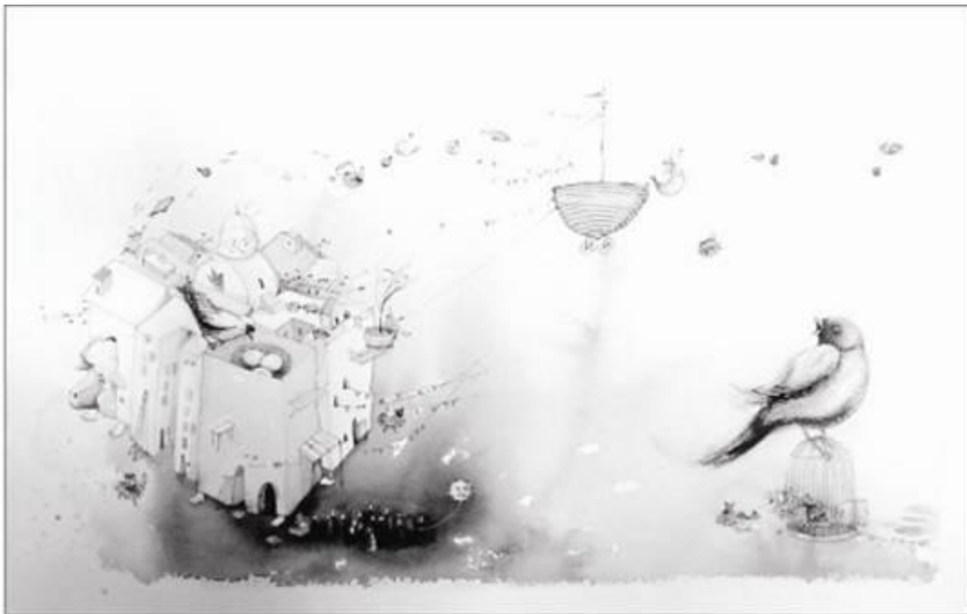
Romanet Zárate. Serie: Mirabilia II . Acuarela sobre papel de algodón. 2009

Los acuerdos firmados por Bolivia en Cairo, en Beijing en la década de los noventa, se han plasmado en legislación y normativa, en políticas sociales, pero ahí tenemos las enormes brechas en salud y educación, es decir, la norma está bien, pero la realidad está mal. ¿Cómo logramos tender esos puentes? Para poder exigirle al Estado el cumplimiento de esta normativa también es fundamental tener mecanismos para poder hacer veeduría ciudadana, para poder exigir el cumplimiento de estas leyes, el cumplimiento de esta normativa y mientras sigamos diluidas, polarizadas, ya sea por motivos propios o creados por otros intereses, definitivamente es difícil poder encaminar hacia procesos en los que podamos asegurar que la normativa, que la legislación, vayan realmente en beneficio de una mejora de la vida de las mujeres.