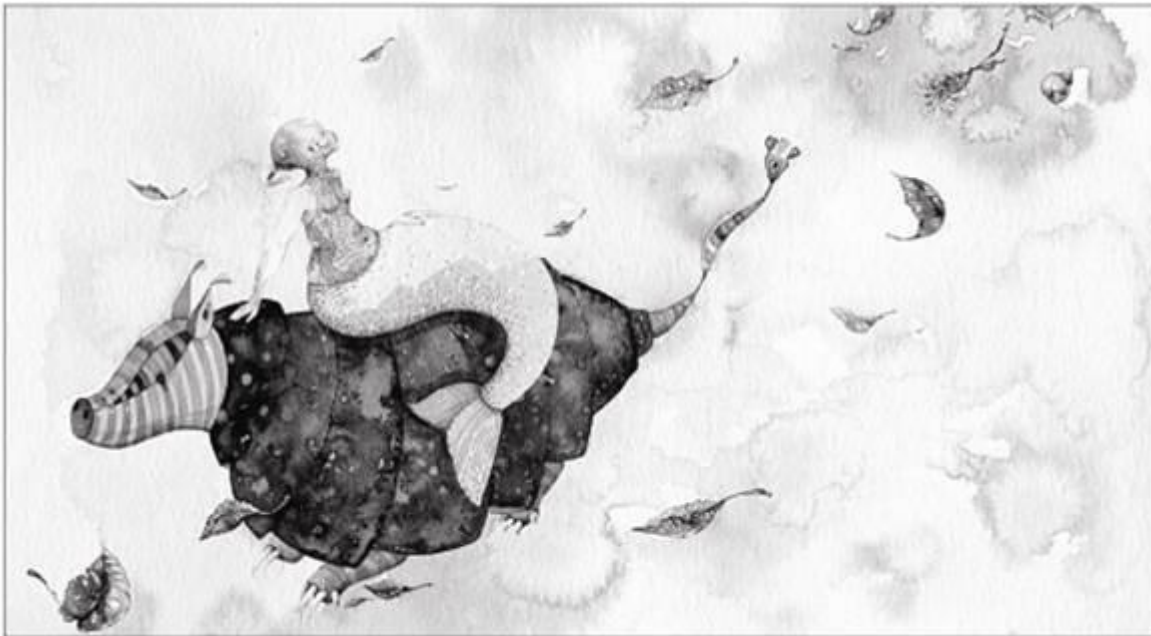
Romanet Zárate. Serie: Mirabilia III . Acuarela sobre papel de algodón. 2009

Por otra parte, no creo que el problema sea que haya mujeres en uno u otro ministerio, creo que el objetivo es qué carácter o qué objetivos institucionales se promueven desde esta instancia y desde mi punto de vista, insisto, tiene que ver con la configuración de un nuevo Estado Social. Eso tiene que pasar por la idea de convencernos nosotras mismas del rol fundamental que jugamos en el marco del desarrollo, en el marco de la organización de la sociedad, de sus capacidades de sociabilización y de protección y cuidado. Si no nos convencemos del lugar que tenemos en el mundo, nunca vamos a plantear la necesidad de institucionalizar nuestras demandas.