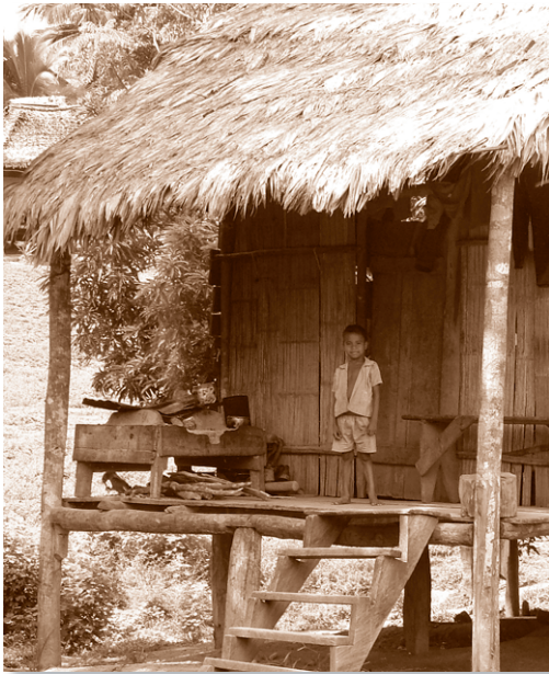
La mayoría de las comunidades étnicas de la Costa Caribe sufren de pobreza extrema.

La pobreza humana es más que escasez o carencia de ingresos. Es la negación de oportunidades económicas, políticas, sociales y físicas para tener una vida larga, salubre y creativa, así como para disfrutar de un nivel de vida decente, libertad, dignidad, autoestima y del respeto de los demás. La pobreza es la principal causa de la inseguridad alimenticia. Su reducción es esencial para mejorar el acceso a una alimentación nutricionalmente adecuada y sana para todos.