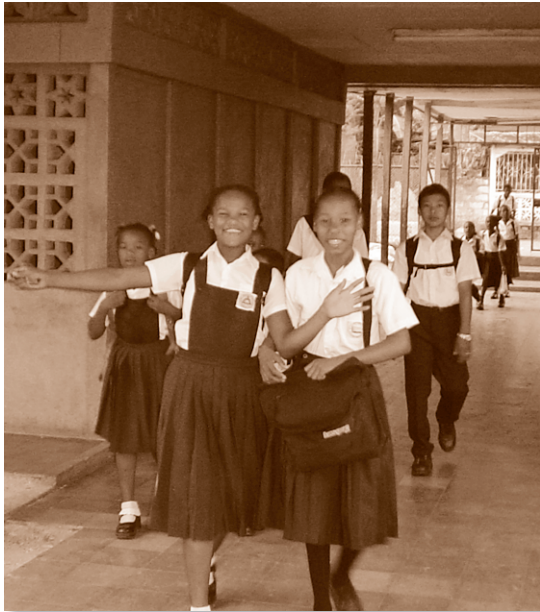
Estudiantes de primaria bilingüe Escuela Dinamarca

La Educación en la Costa Caribe de Nicaragua ha tenido avances significativos que fortalecen el proceso de Autonomía pero que también son el resultado del grado de responsabilidad que la población ha desarrollado. Estos avances se manifiestan tanto en el nivel educativo primario y secundario como el superior.