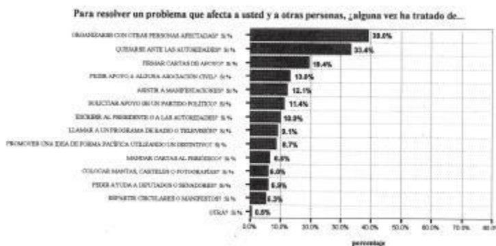
GRÁFICA III. Estrategias para resolver problemas: México, 2003