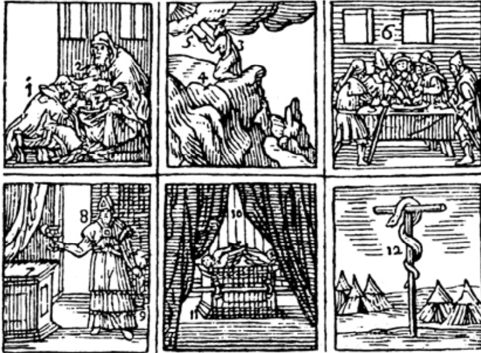
El judaísmo (en Comenio, J.A., 1658, Orbis Sensualim Pictus [El mundo en imágenes, edición en español, Miguel Ángel Porrúa, México, 1994]).