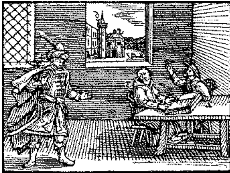
El mahometismo (en Comenio, J.A., 1658, Orbis Sensualium Pictus [El mundo en imágenes, edición en español, Miguel Ángel Porrúa, México, 1994]).

48 La única participación importante conocida no será militar sino propagandística, sale del monasterio de Moissac en el sur de Francia donde poco tiempo después del paso de Urbano, se redacta la falsa encíclica del papa Sergio IV (1009-1012) en la cual, a consecuencia de la toma de Jerusalén por el sultán fatimida al-Hakim, se invitaba a los guerreros cristianos a ir a combatir a los enemigos de Dios culpables de haber destruido la iglesia