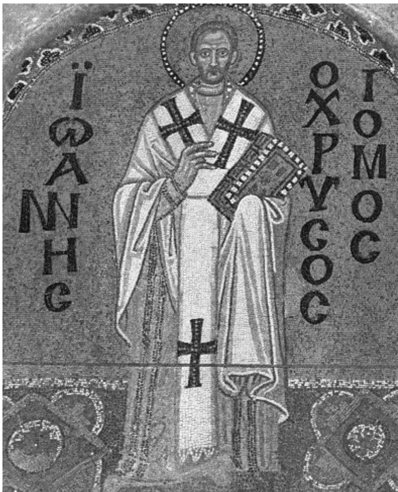
San Juan Crisóstomo, mosaico en la nave de Santa Sofía, siglo X.

Pero antes de ver cómo va a empeorar tenemos que recordar el estatuto del judío antes de los siglos XI y XII y cómo Pedro concibe sus relaciones con ellos: intentaremos presentar un resumen de la figura teológica del judío. 17