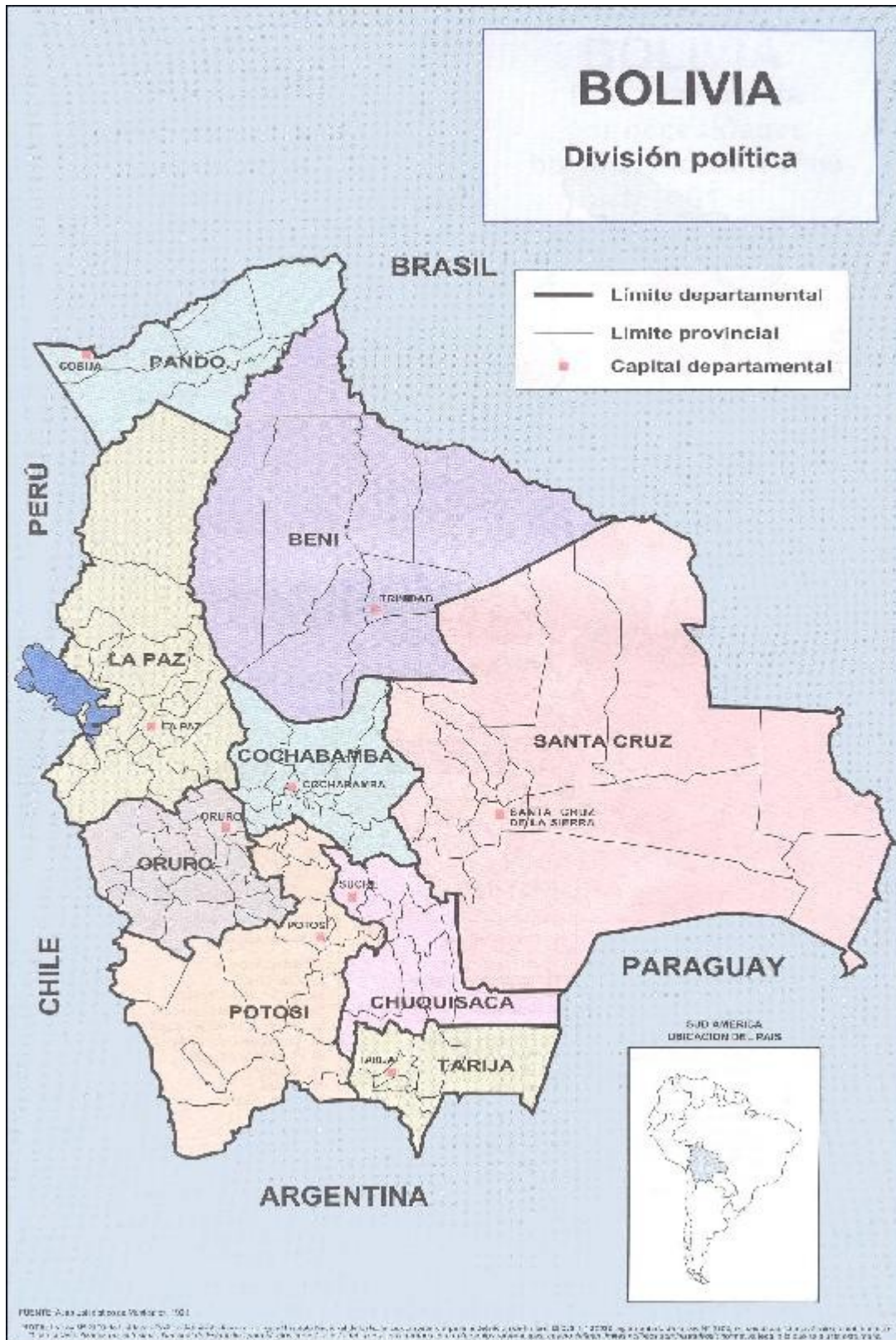
Mapa 2 Departamento de Santa Cruz