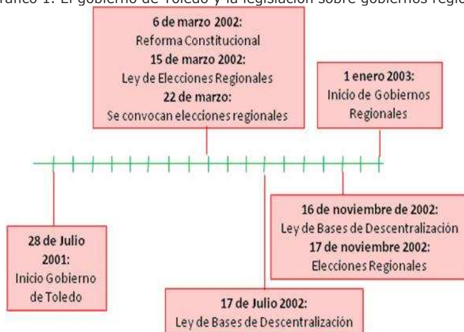
Gráfico 1. El gobierno de Toledo y la legislación sobre gobiernos regionales

Como se observa en la línea de tiempo del Gráfico 1, las elecciones estaban convocadas antes de que se diera incluso la Ley de Bases; es más: la Ley de Elecciones Regionales (sin la cual no se podían convocar) establece el sistema a través del cual deben elegirse unos representantes cuyas funciones son desconocidas, pues serán definidas más adelante. En el poco tiempo de elaboración legislativa (para la importancia de las normas), el marco institucional resultante contiene más prejuicios e inercias del periodo fujimorista que un claro esfuerzo de producción institucional democrática.